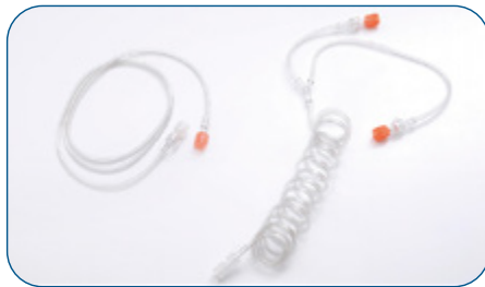
Tubos para CT (Rectos y enrollados)