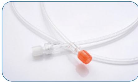
Tubos para CathLab (600psi)