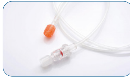
Tubos para CathLab (1200psi)